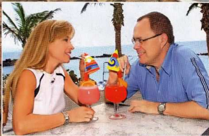
Am Strand von Playa Blanca genossen die beiden ihren abendlichen Cocktail