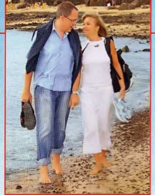
Das Paar hat lernen müssen, sich immer wieder von Neuem Zeit füreinander zu nehmen

schlossen, wieder mehr für ihre Liebe zu tun und sich mehr Zeit füreinander zu nehmen. Der erste Schritt: Sie buchten einen Urlaub auf ihrer Lieblingsinsel Lanzarote – und setzten einen Heiratstermin fest! „Im Mai wollen wir den Bund fürs Leben schließen, wieder auf einer sonnigen Trauminsel.“ Mehr will das Paar noch nicht verraten. Aber längst ist klar: „Unsere Hochzeit soll ganz romantisch werden!“